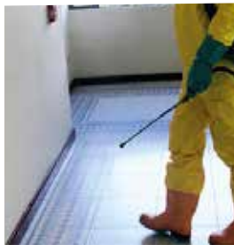
LIMPIEZA Y CLORIFICACIÓN