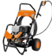
HIDROLAVADORAS ALTA PRESIÓN