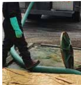
LIMPIEZA Y EVACUACIÓN DE POZOS SÉPTICOS.