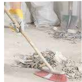
LIMPIEZA DE OBRA.