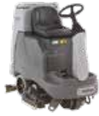
LAVADORAS DE PISOS HOMBRE A BORDO