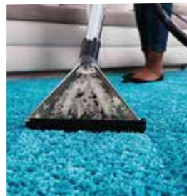
LAVADO DE ALFOMBRAS Y MUEBLERÍA.