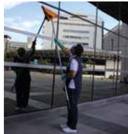
TRABAJOS EN ALTURA (VIDRIOS, VENTANAS, FACHADA, ALUCOBOND).