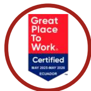
GREAT PLACE TO WORK ECUADOR