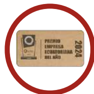
EMPRESA ECUATORIANA DEL AÑO